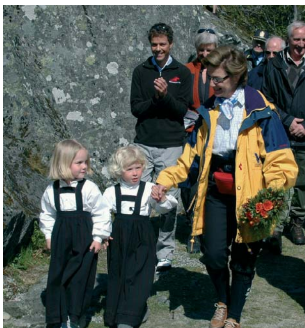
Opning av Folgefonna nasjonalpark.

Overvaking av den urovekkjande situasjonen for hekkebestandane av fleire sjøfuglartar held fram. Fylkesmannen kartla i 2005 alle hekkekoloniane for sjøfugl i Hordaland. Situasjonen for dei aller fleste fiskeetande sjøfuglartane er no dramatisk over det meste av Vestlandet, og Fylkesmannen har teke initiativ til å samordne forvaltninga av marine ressursar som fisk og sjøfugl på Nordsjøkysten betre enn tilfellet så langt har vore. Særleg for makrellterne og raudnebbterne er tilstanden dyster. Flokken er redusert med 90 % dei siste 25 åra.