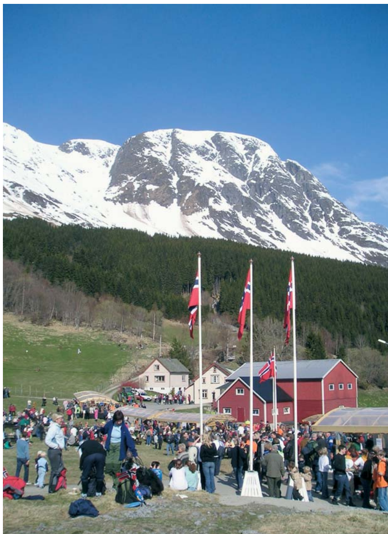
Opninga av streif 2005.

Stafettpinnen frå dette første streifet gjekk vidare til åtte andre spennande kulturlandskap i Hordaland. Kvar tur hadde eit eige tema som synte mangfaldet av kulturlandskap, historie og ikkje minst menneske som lever i og av landskapet. På kvar tur ønskte vi å gje deltakarane ein smak av landskapet med mat laga i området. Til saman deltok 8000 på dei ulike streifa i Hordaland.