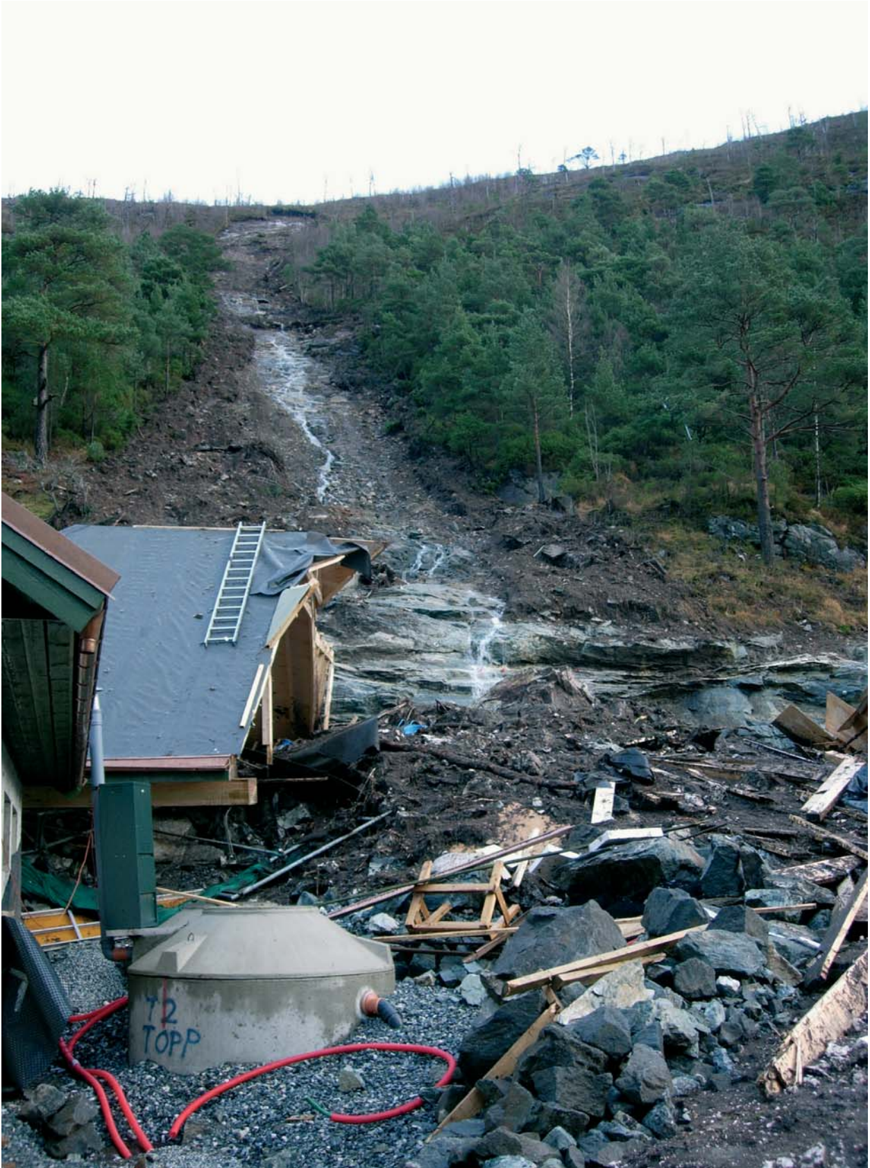
"Loke" (Hetlebakka) 14. november 2005.