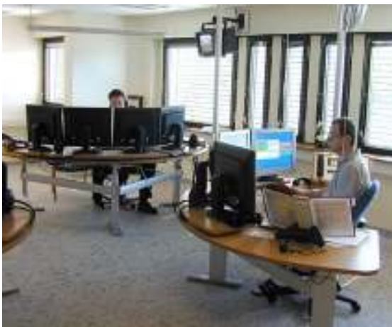
AMK Haugesund