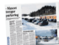
Adressavisen 29. mars

FAKTA Trondheim vokser som aldri før. Innen 2020 vil innbyggertallet passere 200 000. I en serie artikler ser Adresseavisen nærmere på konsekvensene av befolkningsøkningen.