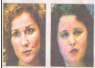
Av barne- og likestillingsminister Karita Bekkemellem (tv.) og helse- og omsorgsminister Sylvia Brustad.