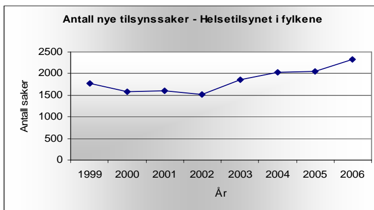
Figur 2.1: Utviklingen i antall nye saker 1999-2006

Krav til saksbehandlingstid fastsatt ifm. statsbudsjettet, er at mer enn halvparten av sakene skal være behandlet innen fem måneder (median 5 md). Dette ble oppnådd i ni av fylkene i 2006, en nedgang fra 15 fylker i 2005 (Oslo og Akershus ble telt hver for seg). Kravet ble heller ikke nådd for alle fylkene sett under ett. Kravet gjelder imidlertid ved maksimalt 1 700